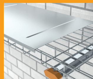
Deckel ab 400 mm Breite mit Quersicken