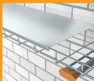
Deckel bis 300 mm Breite ohne Quersicken