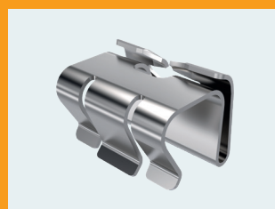
Flexible Anpassung an unterschiedliche Blechstärken durch Federn im Klammer- profil